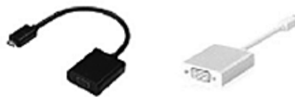
付属外部出力 ケーブル 例